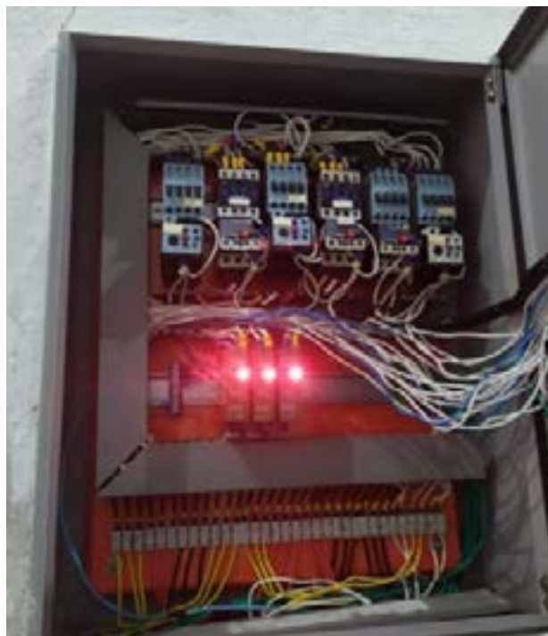
Readequação e correção.