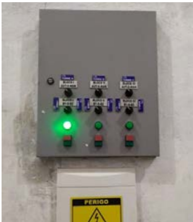
Manutenção preventiva em painéis de comando.